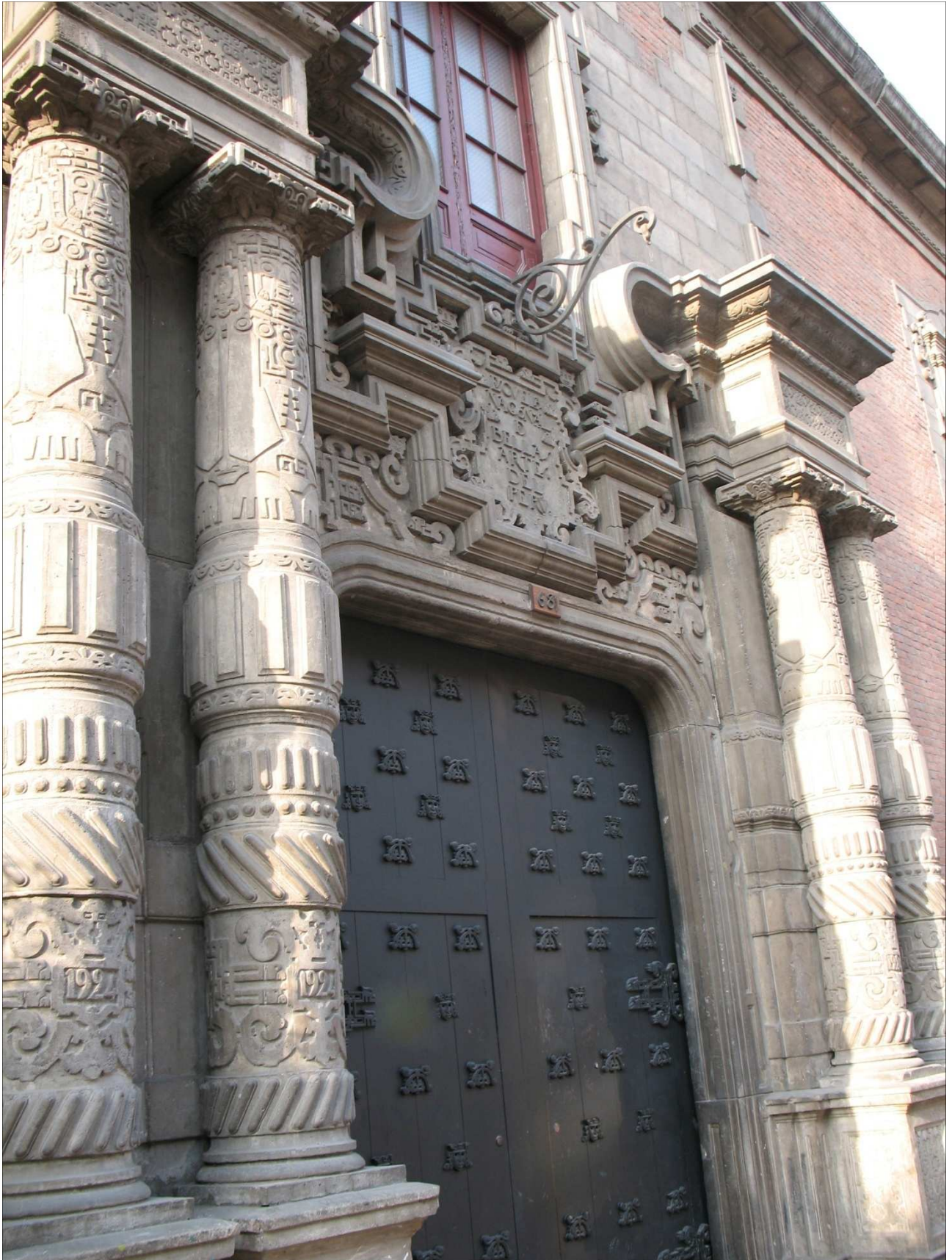
Frontis de la Escuela Nacional Superior Autónoma de Bellas Artes del Perú- ENSABAP.